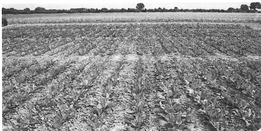
Overzicht van het proefveld in Poperinge in juli 2013.

worden de inulineketens in de cichoreiwortels korter. De lengte van de inulineketen wordt weergegeven door de poly-